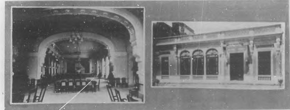
Vista del Salón principal del edificio de la sociedad "El Liceo" de Matanzas inaugurado el domingo pasado.—Vista del edificio de la sociedad "El Liceo", de Matanzas.

Inauguración de "El Liceo" en Matanzas.—Unas vistas presentamos del acto levantado de cultura y gallardo entusiasmo verificados de alegría e ingenio, es "El Liceo", lugar de expansiones de civilidad y acor a los pasatiempos honrosos, al dulce vagar de los