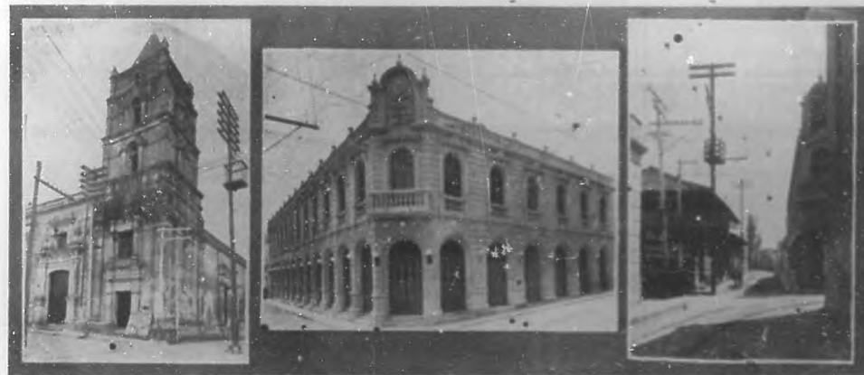
CENTENARIO DE LA AVELLANEDA.—Iglesia de la Soledad donde fue bautizada la Avellaneda. Teatro Avellaneda en la misma ciudad. "Calle Avellaneda" en Camagüey.

Recuerdos históricos en Camagüey se hallan bastantes de importancia si bien no conservados con la religiosidad y el amor patrio que fueran menester. En los salones de El Liceo , (la sociedad filarmónica fundación del esclerido patriota Salvador Cisneros, Marqués de Santa Lucía,