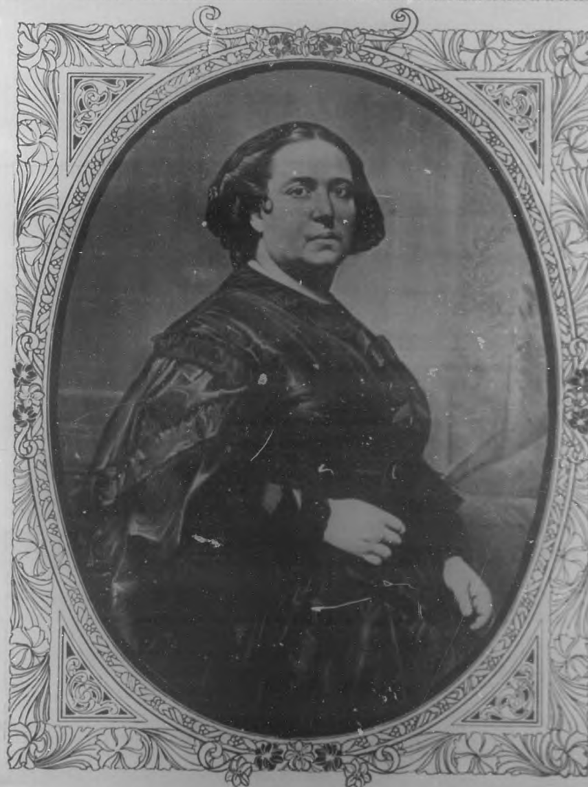
GERTRUDIS GOMEZ DE AVELLANEDA ADMIRABLE PASTEL DE AUTOR DESCONOCIDO.