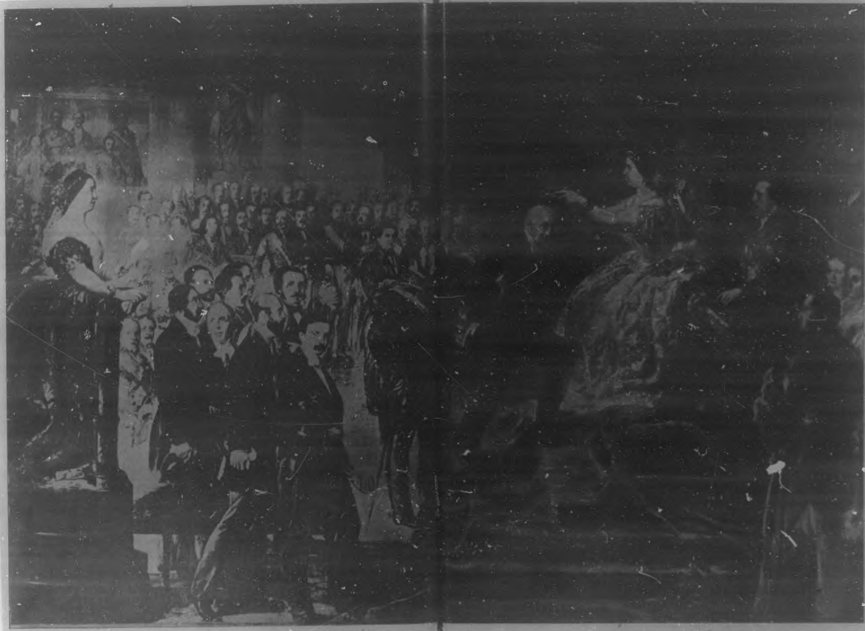
"LA CORONACION DE QUINTANA", cuadro al óleo de Esquivel existente en el Senado de Madrid.—En la izquierda se ve al poeta leyendo la brillantísima oda que compuso expresamente para ese acto. A la derecha, la reina Isabel II coronando al poeta. En el fondo se ven los retratos de la época.