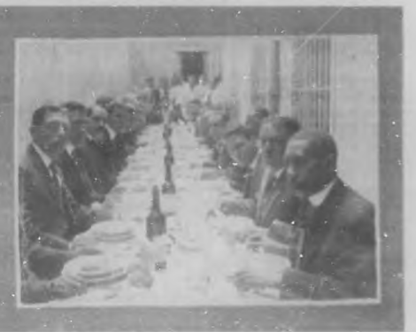
LOS PUERTORRIQUEÑOS EN LA HABANA —Un aspecto del Banquete ofrecido por la Colonia Puertorriqueña a la nueva directiva de la progresista Sociedad que esos elementos han fundado en la Habana.

otras obras, o relacionado con artistas de renombre.