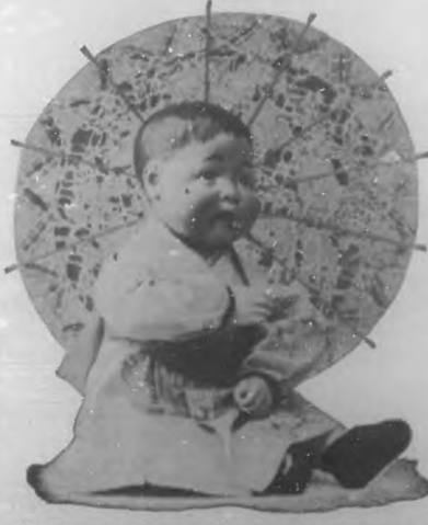
Nuevo y originalísimo muñeco fabricado por la casa americana E. I. Horsman Co. de New York ideado con motivo del resonante triunfo artístico alcanzado por la notable artista Geraldina Farrer en la ópera "Madame Butterfly" de reciente representación en el Metropolitan Opera House de aquella ciudad.

Los congregados en el templo de la Belleza rodean a Julien y le cantan los cantos reservados, para los escogidos, y el poeta en unión de Louise, siente el éxtasis de la gloria y la satisfacción del próximo galardón. Louise y los congregados desaparecen y Julien siente por primera vez los rayos de la Duda. El segundo acto nos transporta a una linda campiña en Hungría, cu-