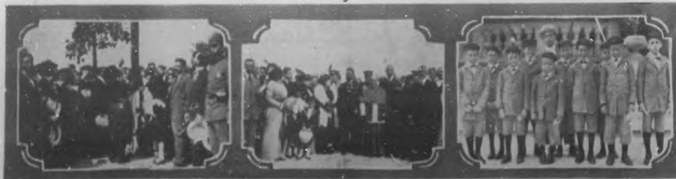
PARQUE "MARIO MENOCAI" EN EL VEDADO —Momento en que el señor Alcalde iza la bandera.—El General Mario Menocal, Autoridades y concurrencia al acto de la inauguración.—Grupo de niños de la Beneficencia a quienes se obsequiaron con patines.